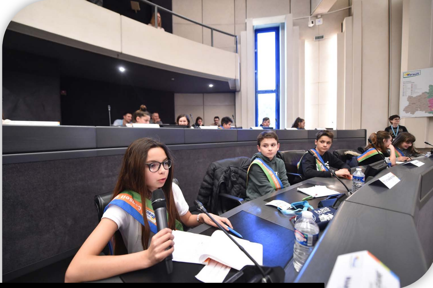
Conseil Départemental des Jeunes (CDJ) 2018/2019