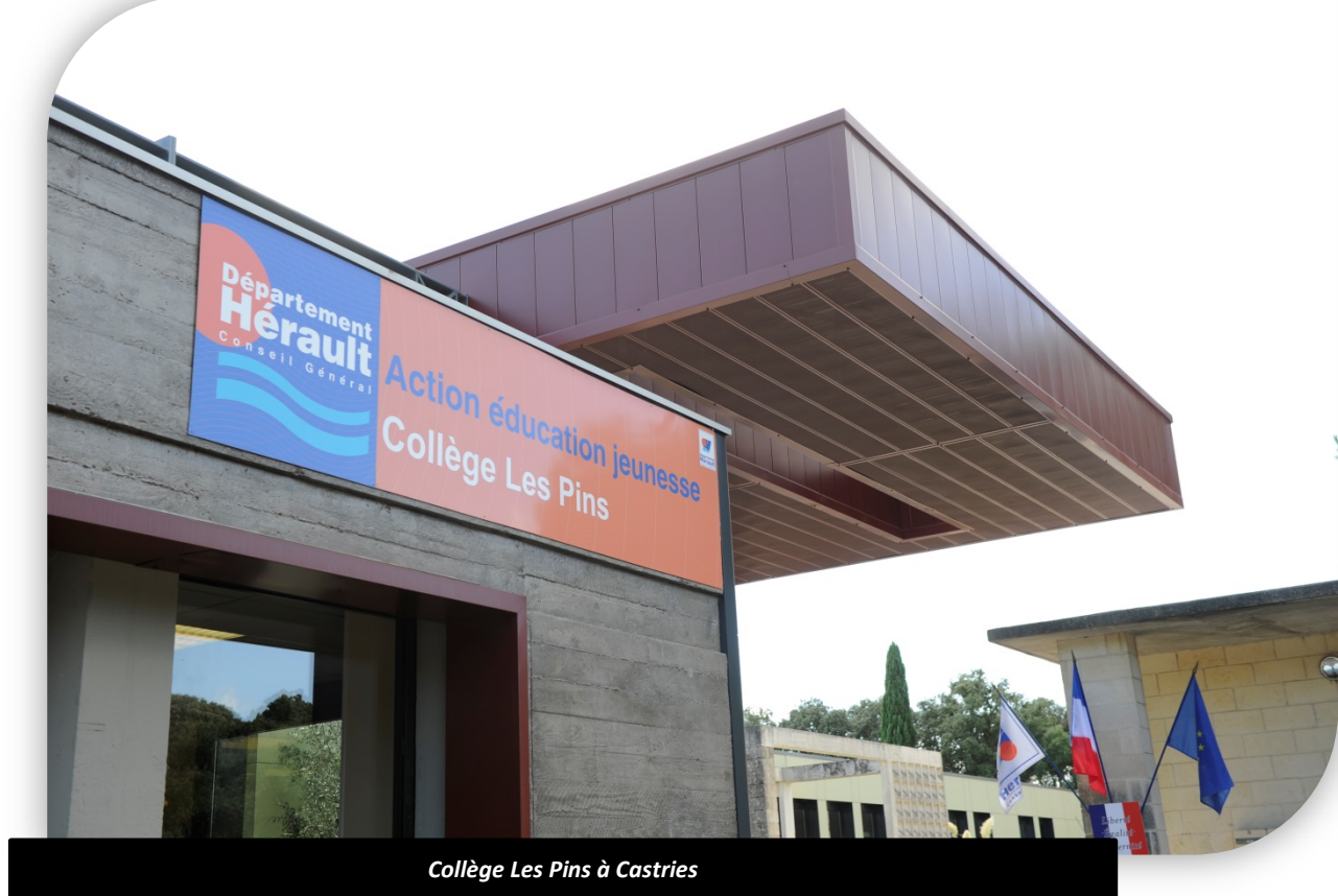
Collège Les Pins à Castries