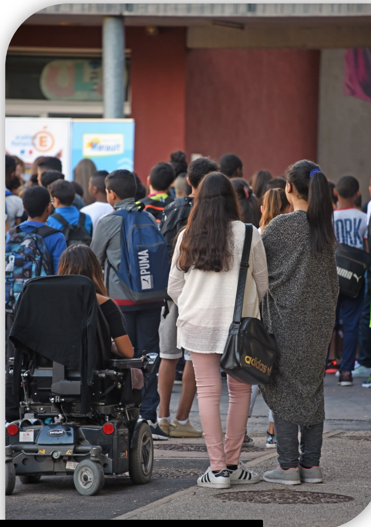
L'accessibilité pour tous

En complément le Département s'est engagé à réaliser 12,2 M€ de travaux sur 9 ans dans le cadre d'un Agenda d'Accessibilité Programmée (approuvé par arrêté préfectoral en octobre 2016).