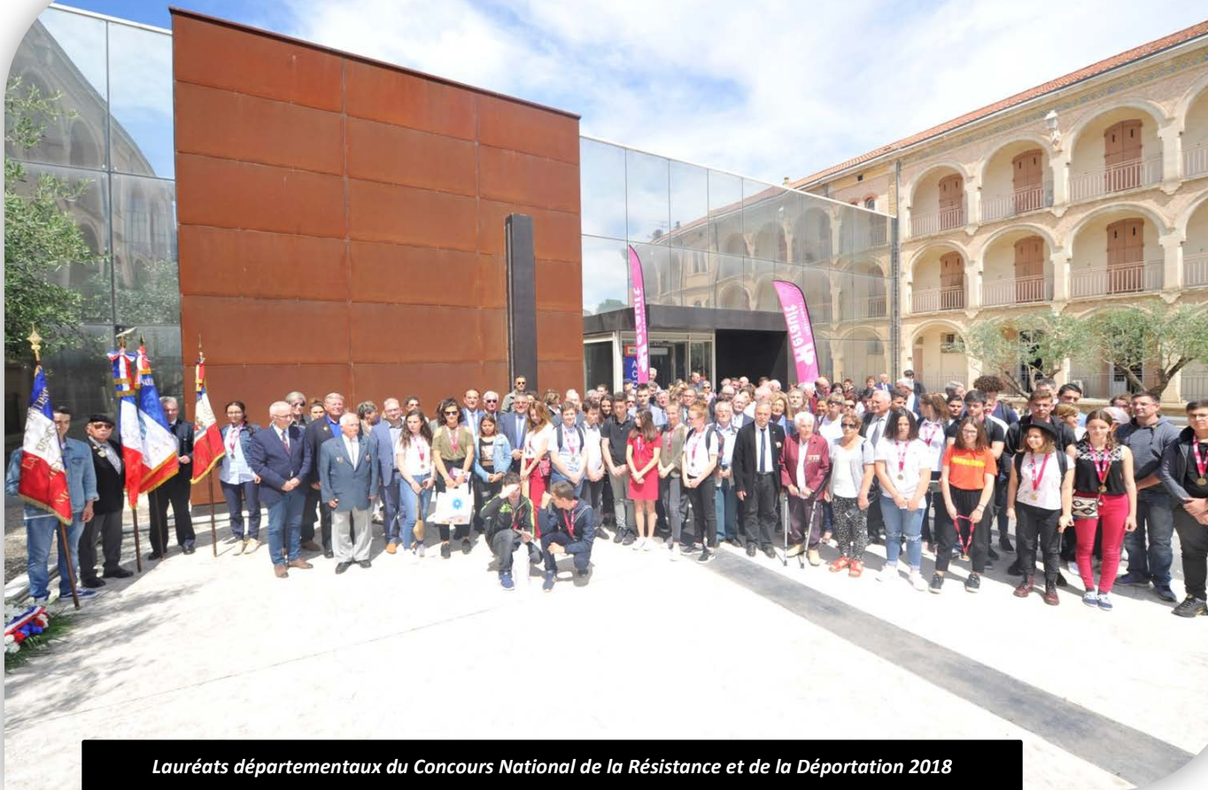
Lauréats départementaux du Concours National de la Résistance et de la Déportation 2018