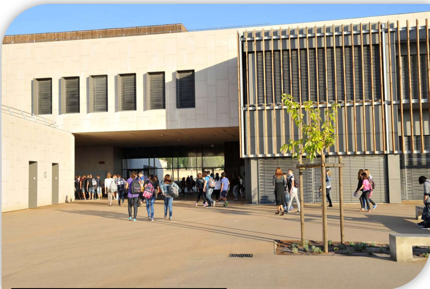
Collège Boby Lapointe à Roujan