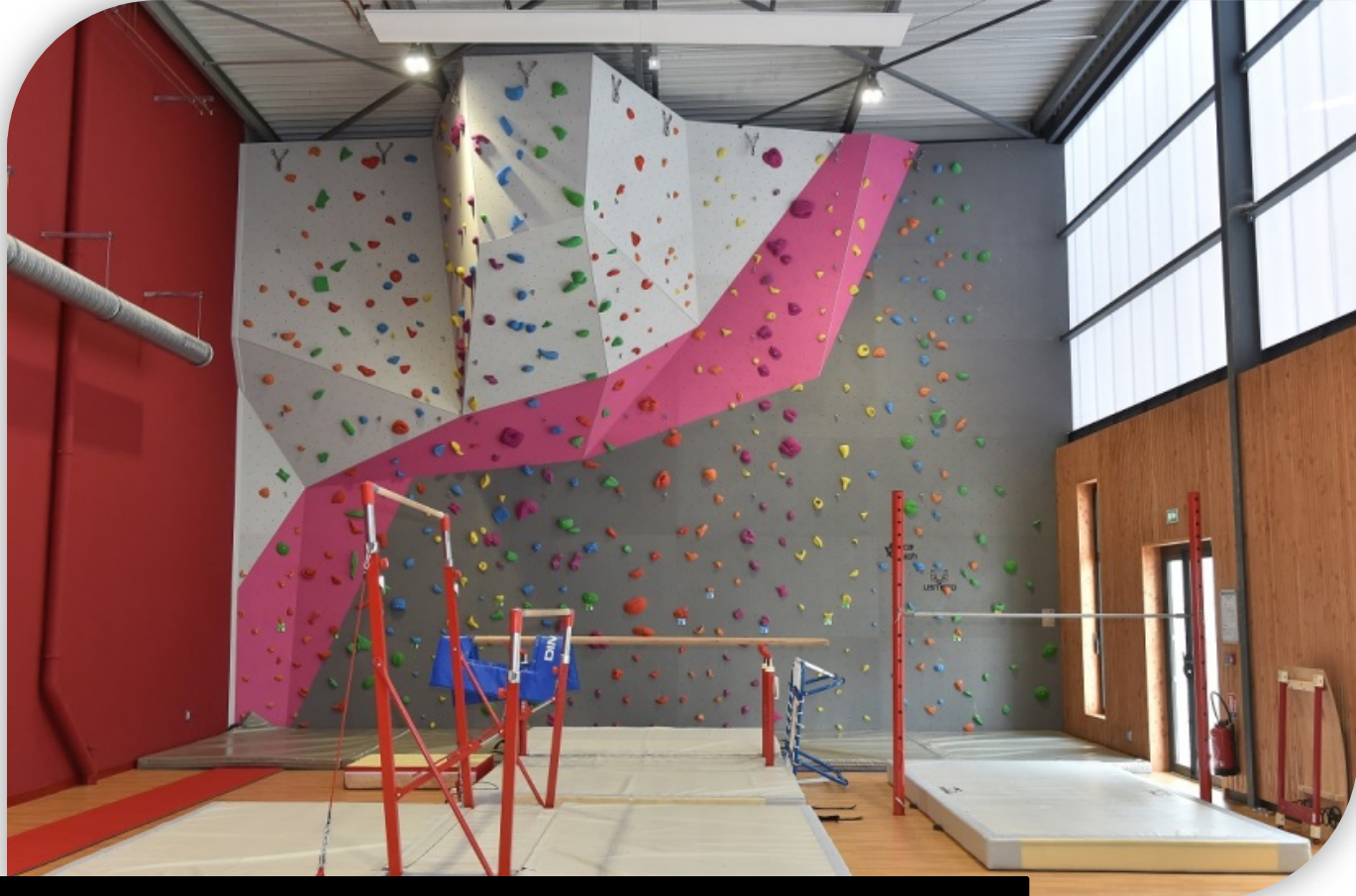
Halle de sports – collège de Loupian