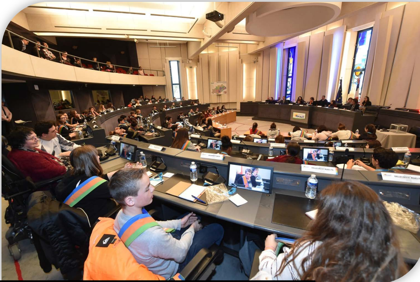
Conseil Départemental des Jeunes (CDJ) 2018/2019