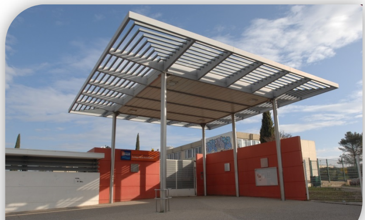
Collège Voie Domitienne au Crès

CHIFFRES CLÉS PLUS DE 20 MILLIONS D'EUROS DE TRAVAUX