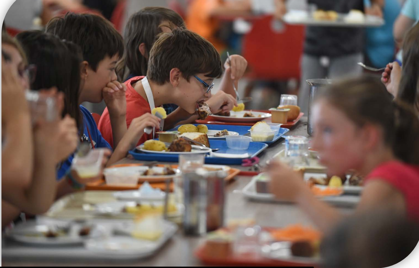
Cantine du collège Fontcarrade Montpellier