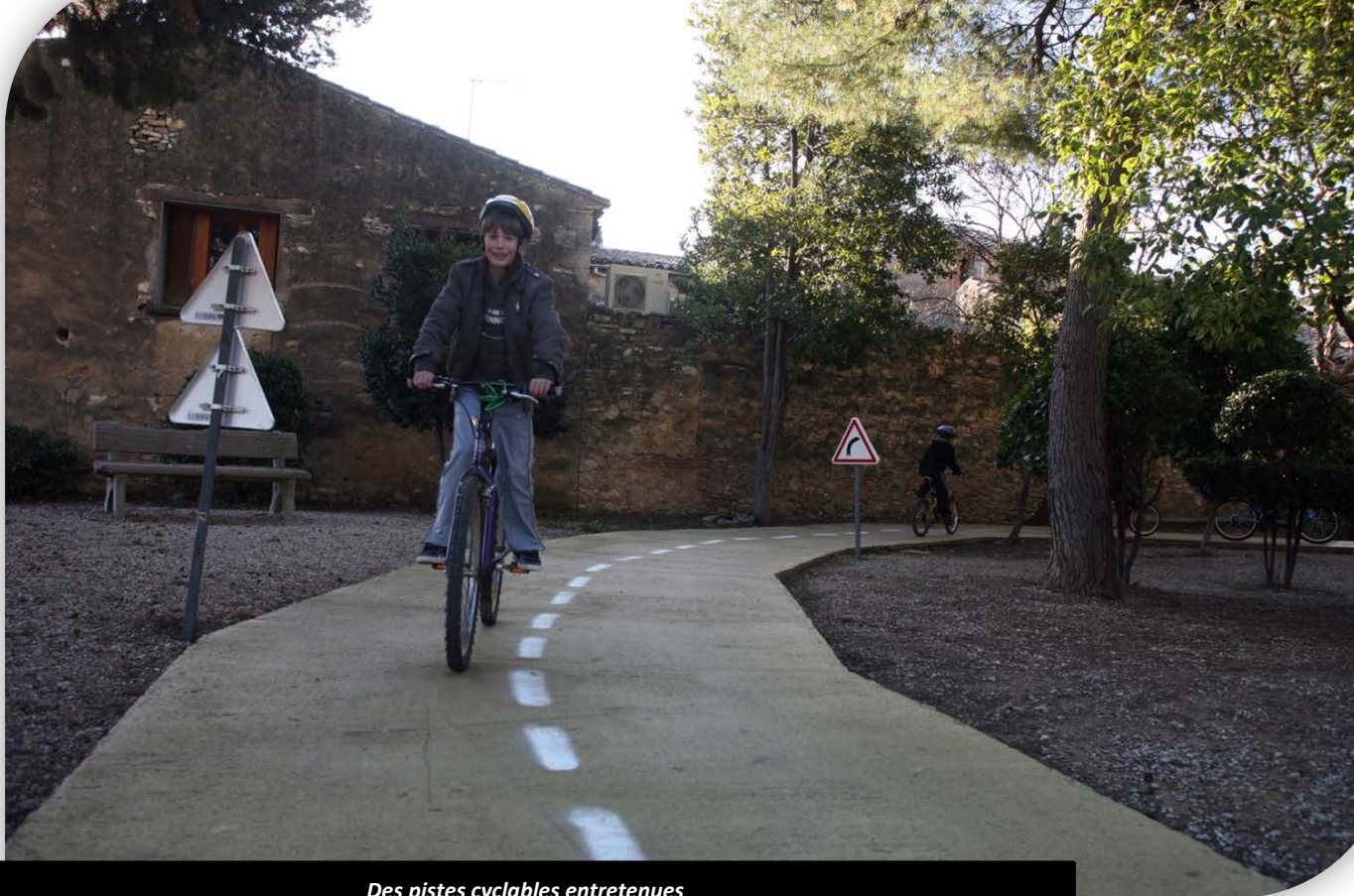
Des pistes cyclables entretenues