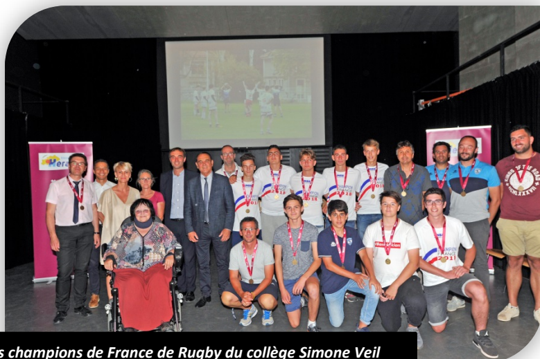
Les champions de France de Rugby du collège Simone Veil

* UNSS : Union Nationale du Sport Scolaire