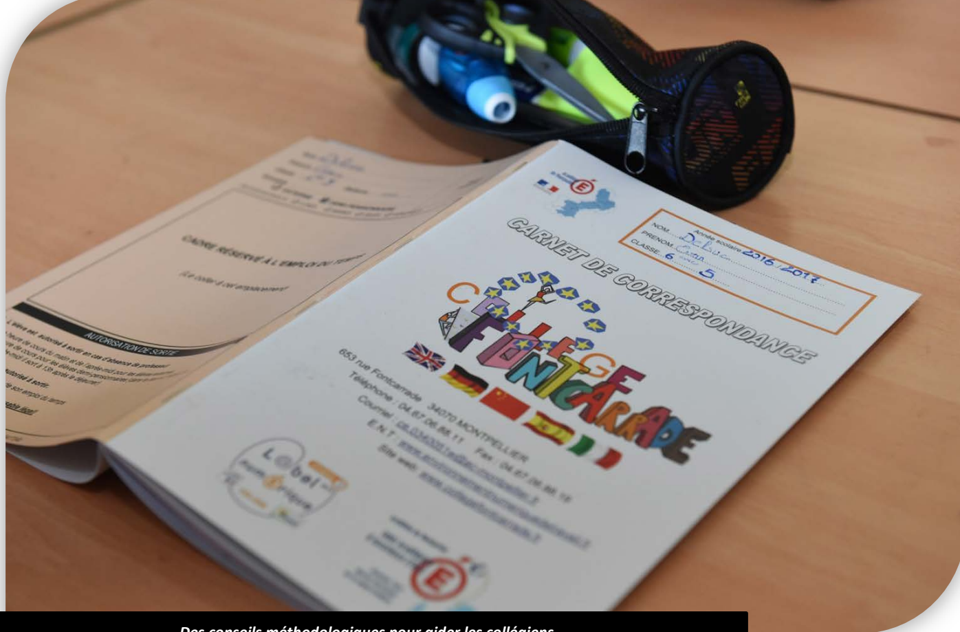
Des conseils méthodologiques pour aider les collégiens