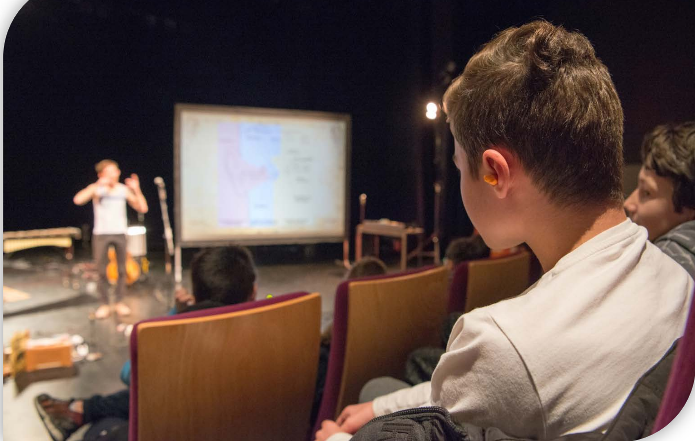
Dispositif Ultrason – concert Passerelles à Jacou

CHIFFRES-CLÉS 280 PROJETS/AN DANS 80 COLLEGES