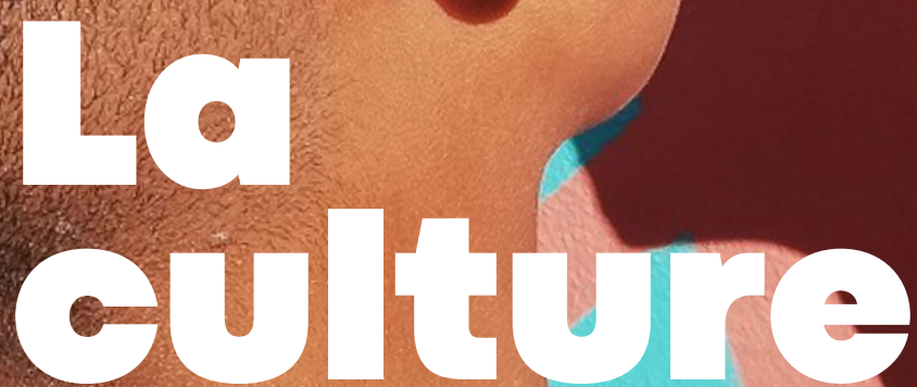
Schéma départemental 2023-2028