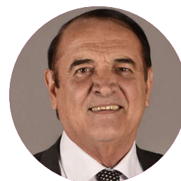
Kléber MESQUIDA Président Département de l'Hérault

Pour répondre à ces enjeux, la politique culturelle du Département de l'Hérault s'appuie sur plusieurs composantes : lecture publique, archives, patrimoine, culture, enseignement artistique.