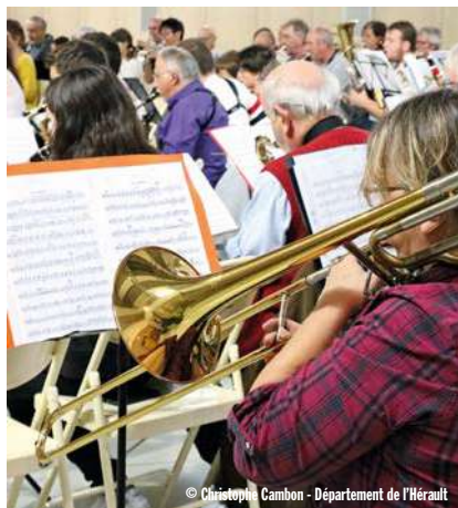
© Christophe Cambon - Département de l'Hérault