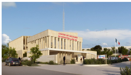
Future caserne de la Restanque à Montpellier.

En France, quelque 195.000 hommes et femmes vivent un engagement quotidien au service des autres, en parallèle de leur métier ou de leurs études. + d'infos sur www.sdis34.fr