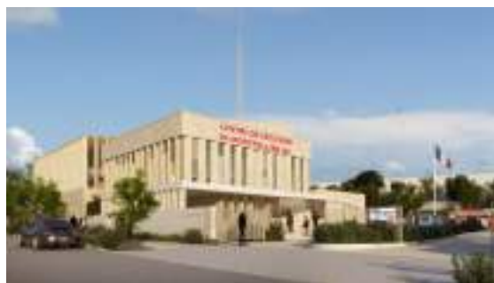
Future caserne de la Restanque à Montpellier.

En France, quelque 195.000 hommes et femmes vivent un engagement quotidien au service des autres, en parallèle de leur métier ou de leurs études. + d'infos sur www.sdis34.fr