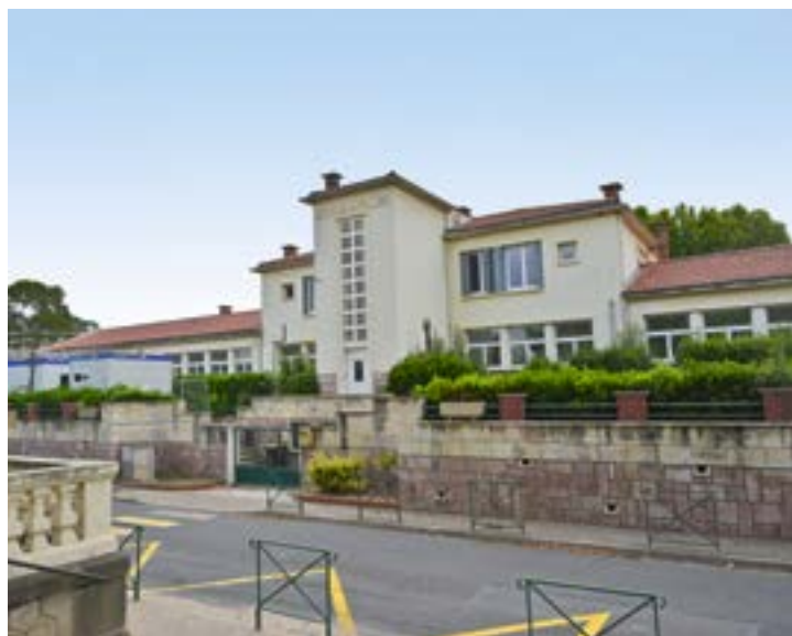
École de Montblanc